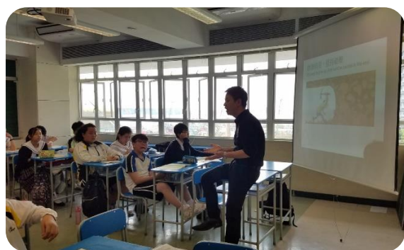
麥校長在課堂中以自己的成長經歷勉勵同學