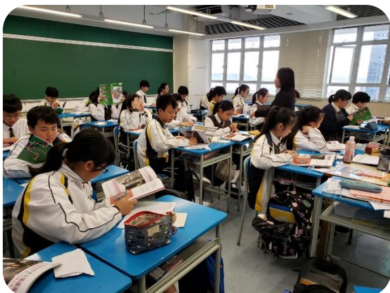
同學正在專心地閱讀文章