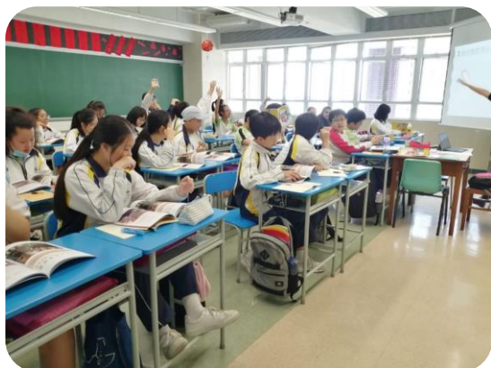
同學們熱烈回應提問

認識工作世界固然是生涯規劃課的重點之一，然而，令學生有面對工作或是未來生活中不同的困難的堅毅與氣魄也是不可或缺的重點，藉著老師、同學的個人分享，配合適切的文章，我們希望可譽人會建立出一份遇強越強、不屈不撓的精神和態度。