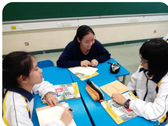
同學在課堂中投入地與他人分享、討論