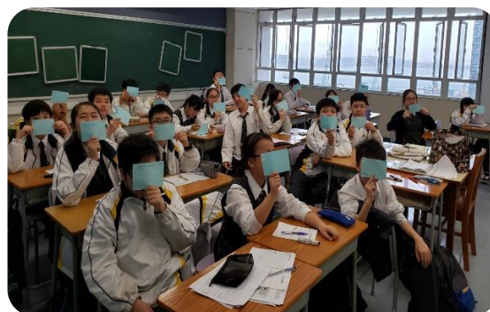
中一同學在分享自己的理想職業